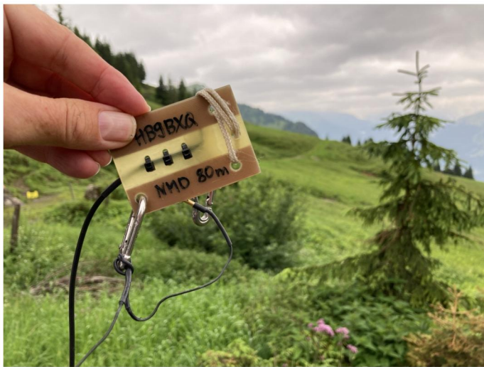
Der 80-m-Dipol (full size) hat sich wiederum sehr bewährt