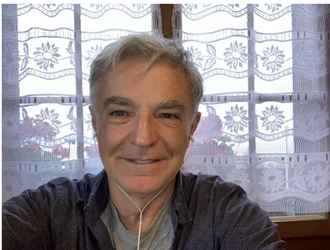
Ein Selfie vor dem Start muss sein