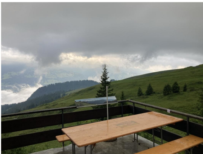
Der von Meteo-Swiss vorhergesagte Sonnenschein am Sonntagmittag