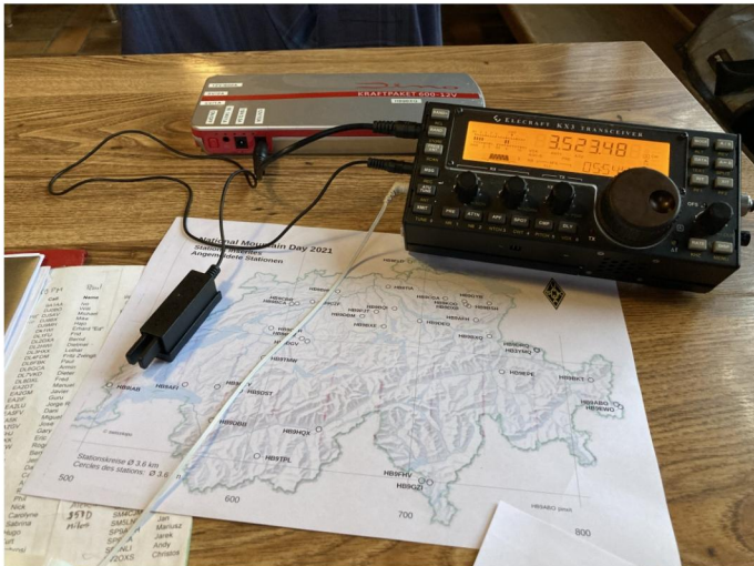
SWR 1:1, U = 12 V, Bleistift gespitzt

Geplant war, den Contest im Freien (auf der Terrasse) durchzuführen, aber noch immer war das Wetter garstig, so dass ich die Station im Innenraum des Restaurants beliest. Start: Wie geplant um 08.00 Uhr HBT.