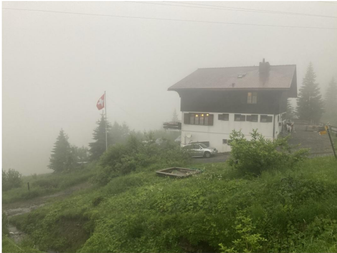
Berghaus Palfries, 1686 m ü. M.