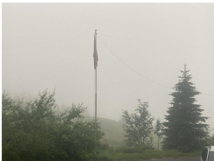
Sprühregen und Nebel beim Aufbau

Nein, ein Bergler kann das natürlich nicht wirklich erschüttern, zudem stand mit dem Berghaus Palfries eine trockene Unterkunft zur Verfügung. Ein Fahnenmast ist dort auch vorhanden, so dass der NMD-Dipol trotz konstantem Sprühregen schnell und ohne grössere Durchnässungen aufgebaut und noch vor dem Nachessen getestet werden konnte. Erste QSO mit HB9EPE Dora und HB9ABO Urs klappten auf Anhieb und mit guten Signalen auf beiden Seiten.